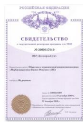
ИБР Договорной учет